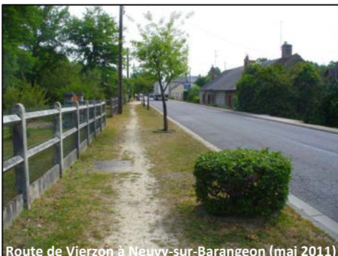
Route de Vierzon à Neuvy-sur-Barangeon (mai 2011)