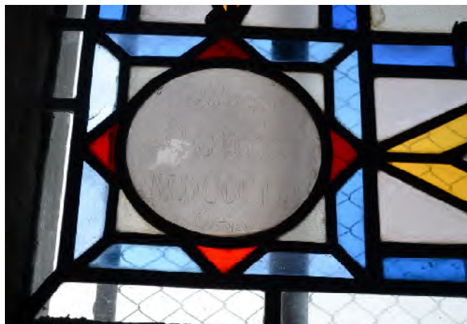
signature du maître verrier en bas de la baie 10

Les vitraux ont été installés entre 1848 et 1852.