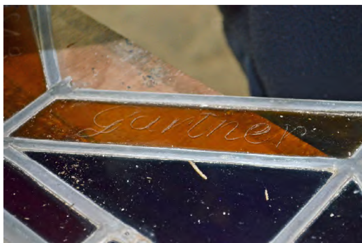
inscriptions du maître verrier sur la baie de la sacristie