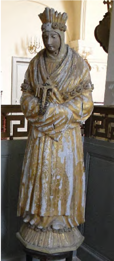
Statue en bois doré qui se trouvait dans la chapelle du cimetière.

La statue la plus remarquable est celle de Notre Dame de la Salette.